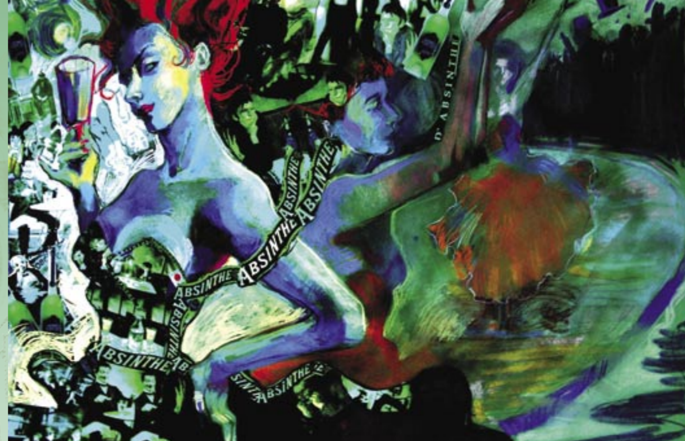
Alina Róża Szczerba